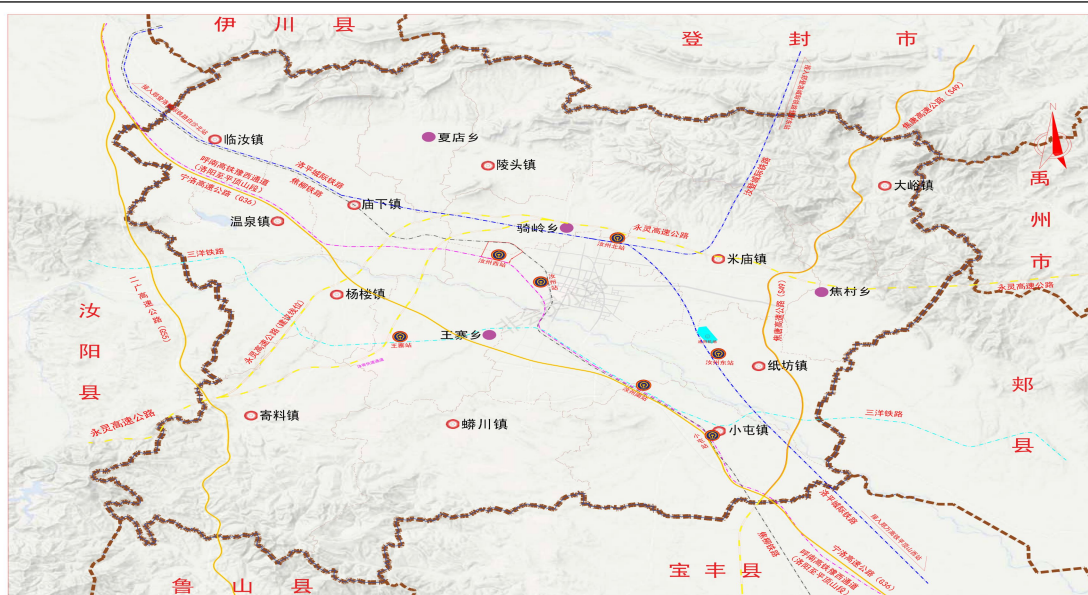
专栏 11 汝州市“十四五”综合交通路网格局

加快“三铁三轨三高六路”建设，推动国省干线提档升级，统筹城乡道路网络布局，助力汝州建设豫西南区域性副中心城市。